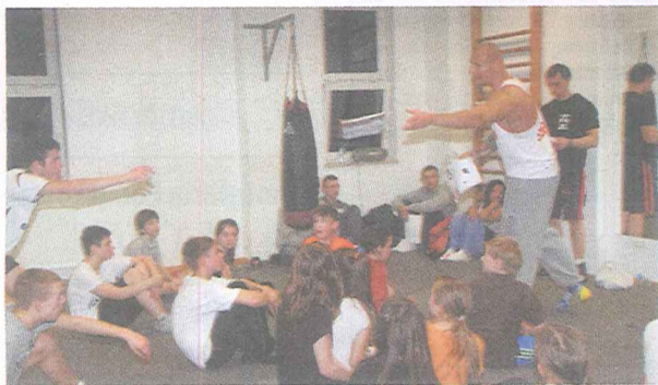
Koszulka dla najlepszych od Mistrza